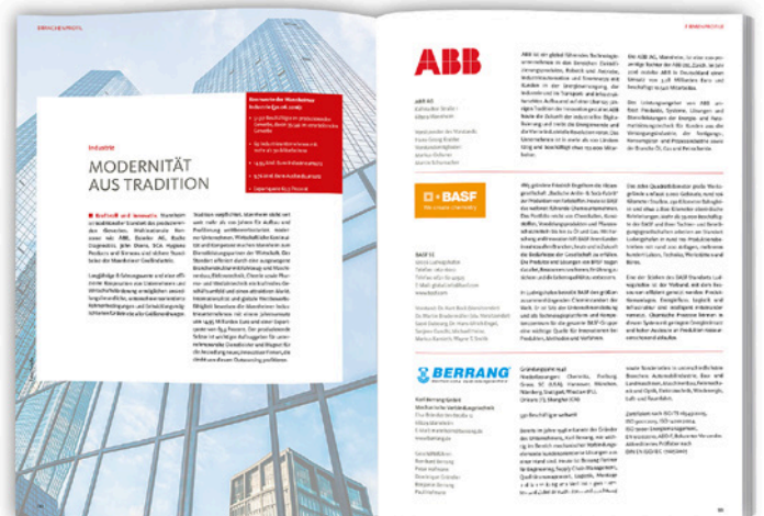
1/1 Anzeige ca. 1/3 Seite