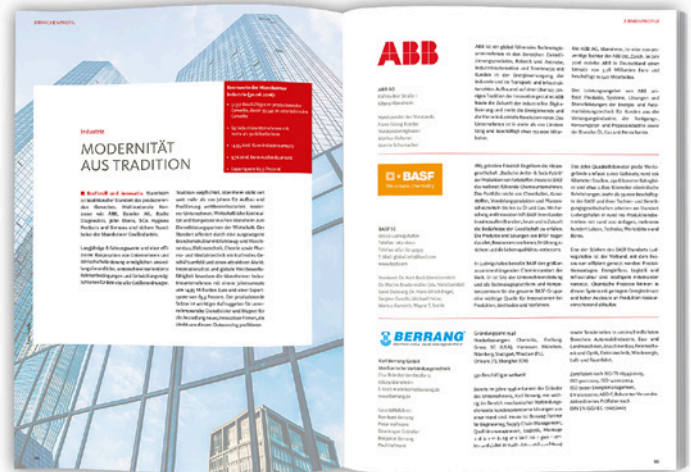
Firmenprofil ca. 1/3 Seite